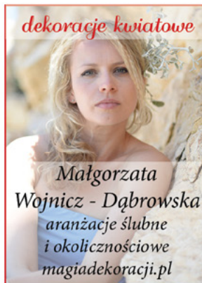
Małgorzata Wojnicz - Dąbrowska aranżacje ślubne i okolicznościowe magiadekoracji.pl